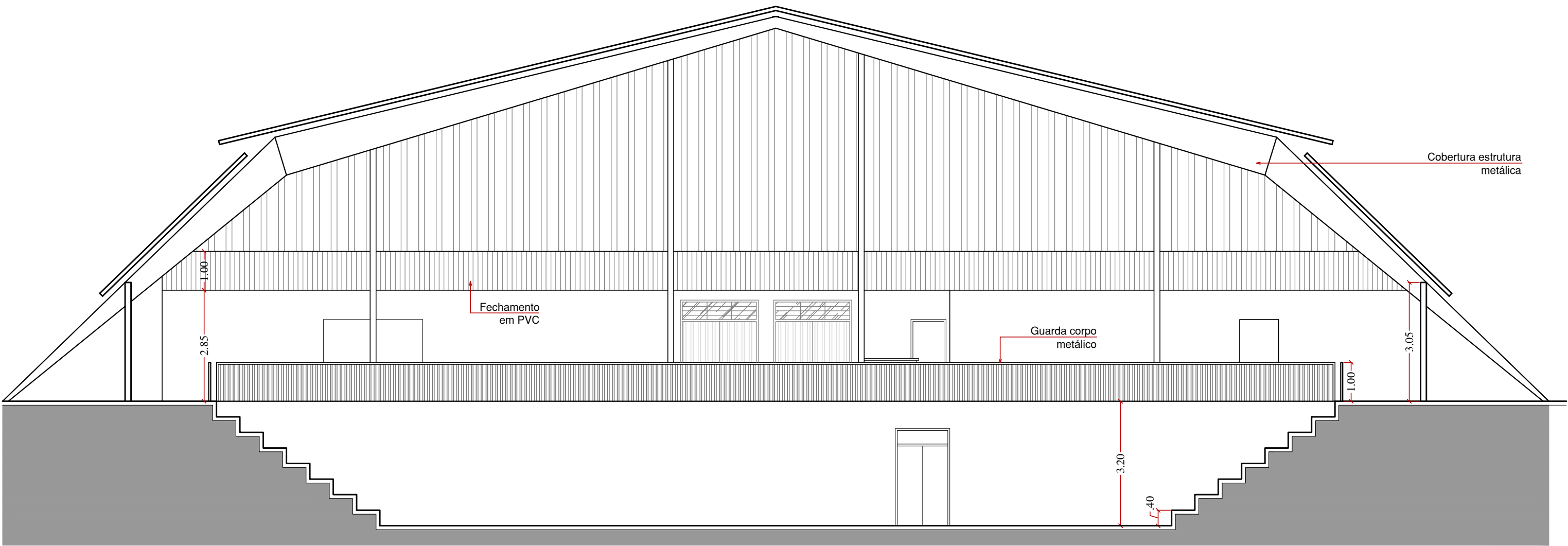
CORTE AA - escala 1/100