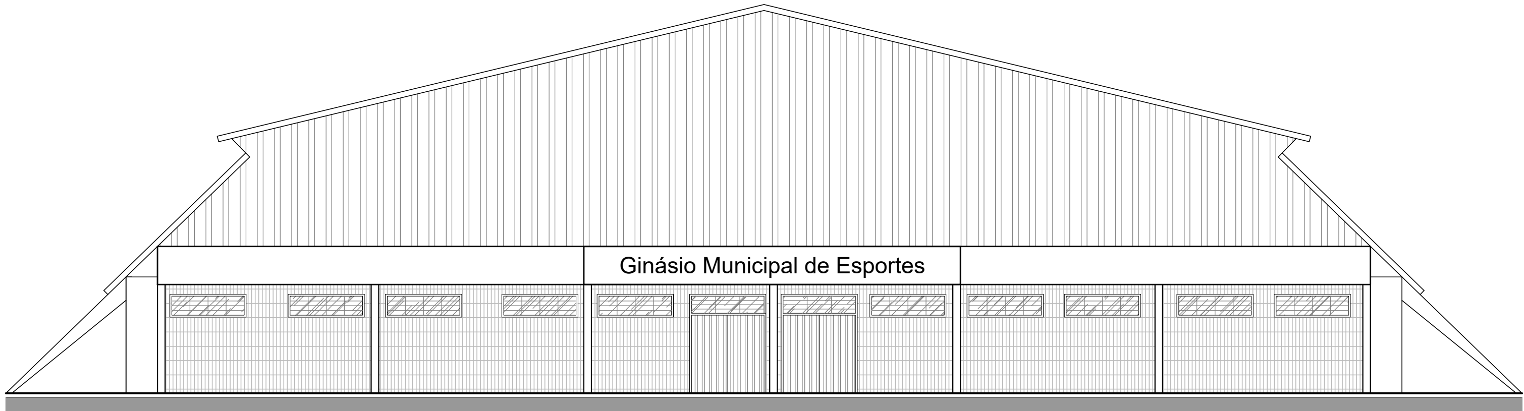
FACHADA (Ginásio) - escala 1/100